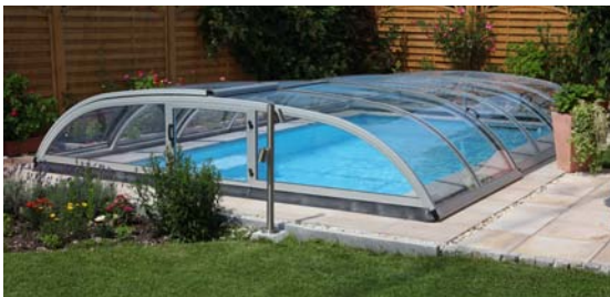
MODELL ZENITH FLAT